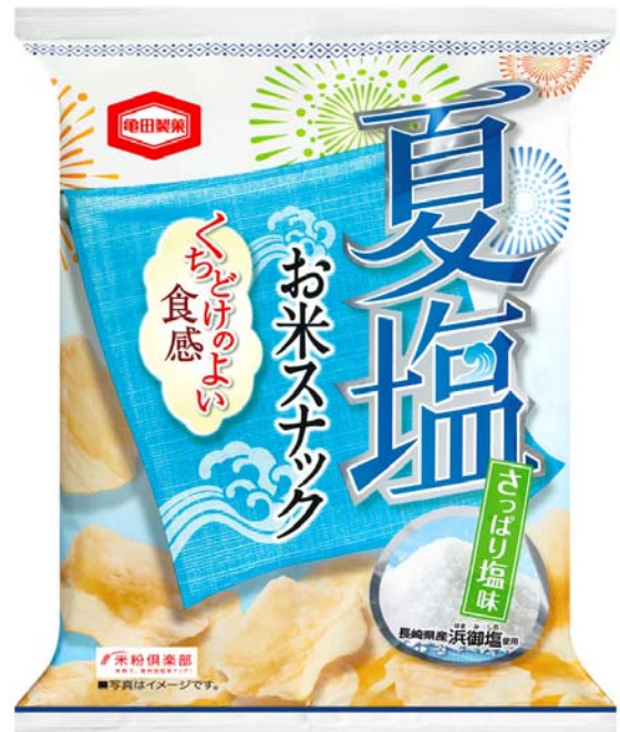
『40g 夏塩お米スナック さっぱり塩味』

青のりを練り込んだ生地を、酸味の効いた梅味に仕上げ、すっきりとした味わいが楽しめます。