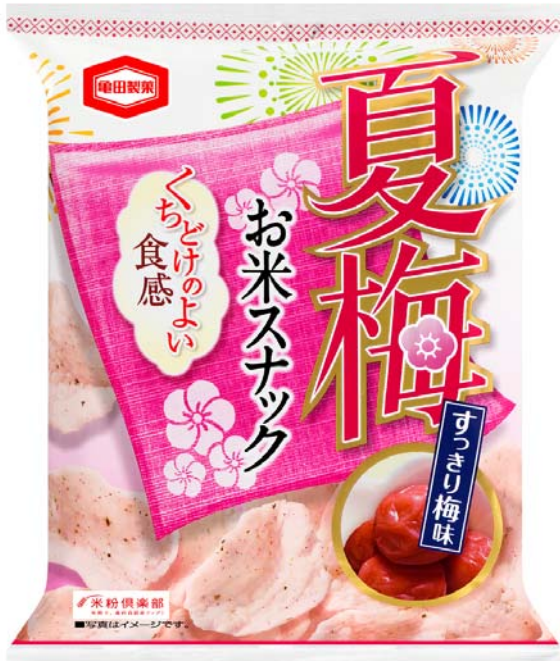
『40g 夏梅お米スナック すっきり梅味』