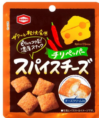
『30g スパイスマイズ チリペッパー』