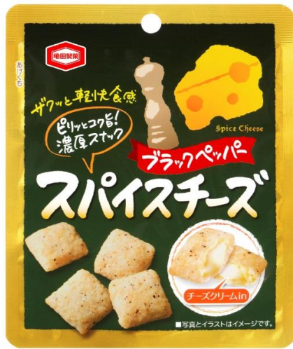
『30g スパイスマイズ ブラックペッパー』