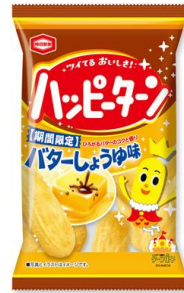
『47g ハッピーターン バターしょうゆ味』