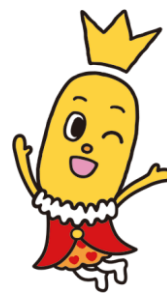
【現行のターン王子】