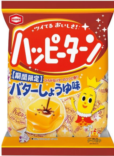
『100g ハッピーターン バターしょうゆ味』