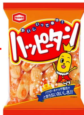
【現行のパッケージデザイン】