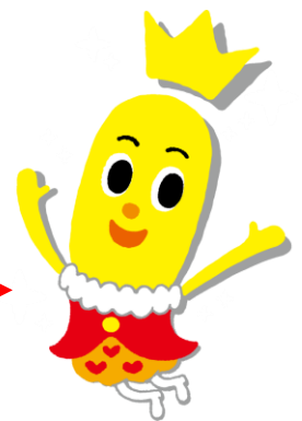
【新しいターン王子】