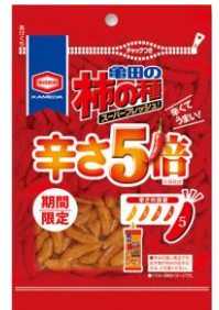
『60g 亀田の柿の種辛さ5倍』

お客様からの、“もっと辛い「亀田の柿の種」を食べてみたい！”の声にお応えし、2014年・2015年と、期間限定で『亀田の柿の種 辛さ5倍』を販売。大変ご好評をいただきましたが、「もっと辛くして欲しい！」「まだまだ足りない」というご意見も頂戴し、この度辛さ5倍をさらに上回る・・・驚きの“7倍”を販売いたします。