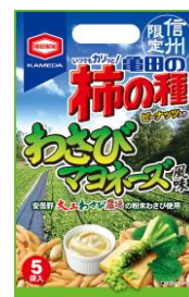
【信州限定】 わさび マヨネーズ風味