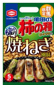
【群馬限定】 焼ねぎ風味