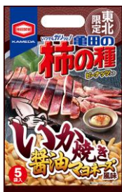
【東北限定】 いか焼き醤油 マヨネーズ風味