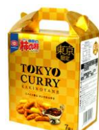
【東京限定】 TOKYO CURRY