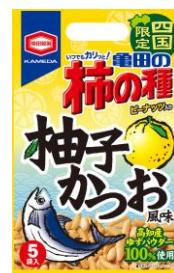
【四国限定】 柚子かつお風味