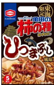
【東海限定】 ひつまぶし風味