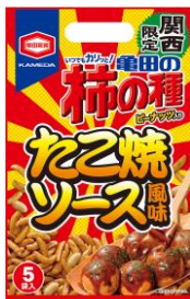
【関西限定】 たこ焼ソース風味