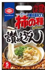
【四国限定】 讃岐うどん風味