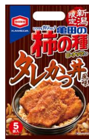
【新潟限定】 タレかつ丼風味