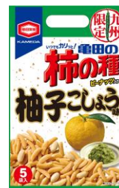
【九州限定】 柚子こしょう味