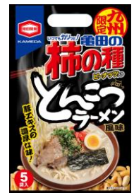
【九州限定】 とんこつ ラーメン風味