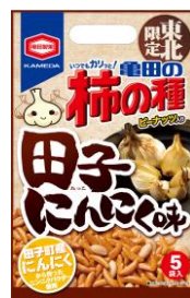
【東北限定】 田子にんにく味