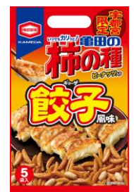
【宇都宮限定】 餃子風味