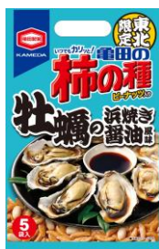
【東北限定】 牡蠣の浜焼き 醤油風味