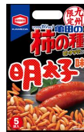
【九州限定】 明太子味