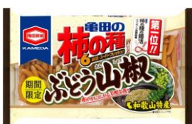
【2013年度販売/和歌山県】 ぶどう山椒※