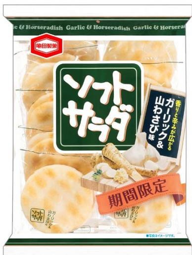
『18枚 ソフトサラダ ガーリック&山わさび味』