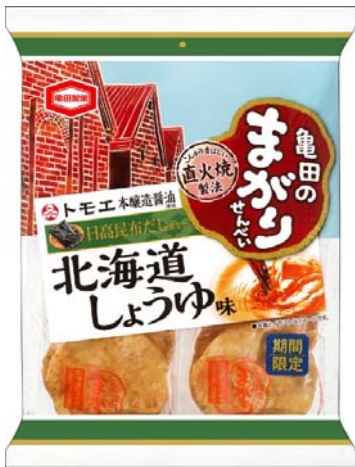
『18枚 亀田のまがりせんべい 北海道しょうゆ味』