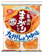
「18枚 亀田のまがりせんべい 九州しょうゆ味」 ※現在は販売していません。

『亀田のまがりせんべい 北海道しょうゆ味』には、北海道で創業125年以上の歴史をもつ福山醸造株式会社の「トモエ本醸造醤油」に日高昆布だしを加えたうまみしょうゆを使用。「亀田のまがりせんべい」のカリッとサクッとした食感はそのままだに、トモエ本醸造醤油ならではの豊かな香りとうまやかな甘み、日高昆布だしの旨みがきいた上品な味わいをお楽しみいただけます。