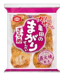
「18枚 亀田のまがりせんべい」「14枚 亀田のまがりせんべい のり」「12枚 亀田のまがりせんべい ざらめ」