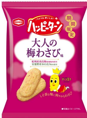
『32g ハッピーターン 大人の梅わさび味』

ハッピーターンは1976年に発売し、長い間幅広い世代の方々にご愛顧いただいている大人気のロングセラー商品です。近年は数々の期間限定商品の販売や、アソートパックの発売などで幅広い世代の方々にご好評いただいております。コンビニエンスストア先行発売商品として展開しているハッピーターンの“大人の”シリーズは、これまでに様々な味を展開し、女性のお客様を中心にご支持をいただきました。