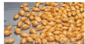
醤油だれをかけてパリッと乾燥