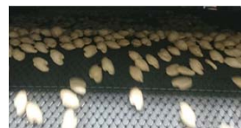
熱風でぷっくりとふくらませる

国産米のうすい生地を2枚重ねて、熱風でぷっくりお米の形にふくらませました。醤油だれをかけてパリッと乾燥させて、香ばしくリズムカルで軽やかな食感に仕上げました。