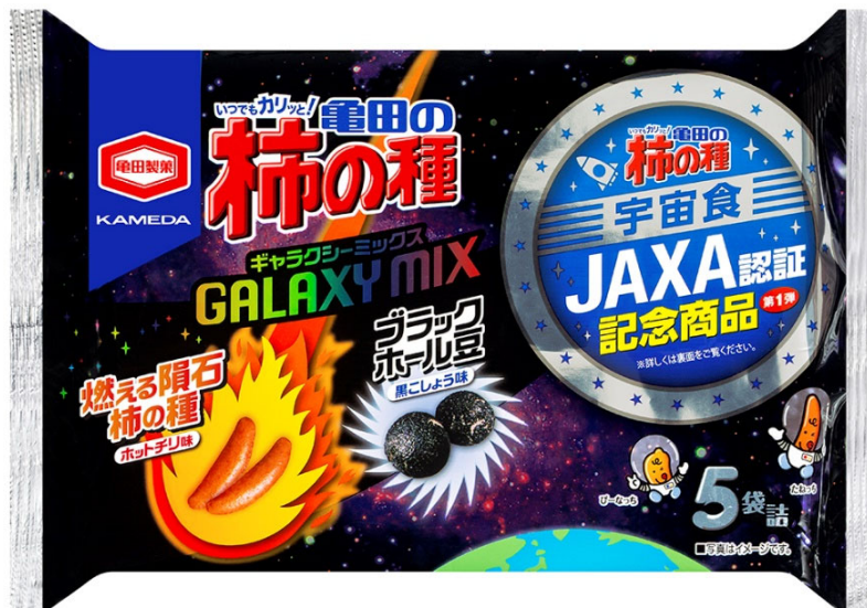
『125g 亀田の柿の種 ギャラクシーミックス 5袋詰』