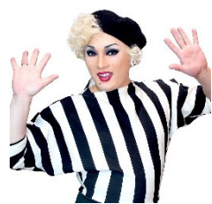
ナジャ・グランディーバ