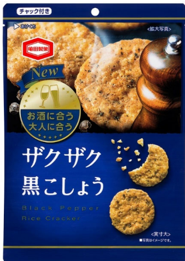
『105g ザクザク 黒こしょう』