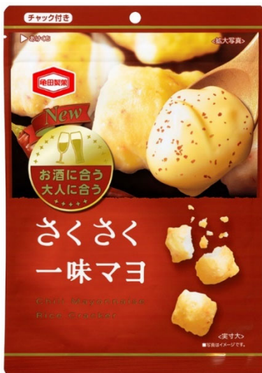
『95g さくさく 一味マヨ』

コロナ禍における家飲み需要に亀田製菓の米菓製造技術で応えたいという思いから、亀田製菓の技術が詰まった新しいおつまみ米菓を提案します。