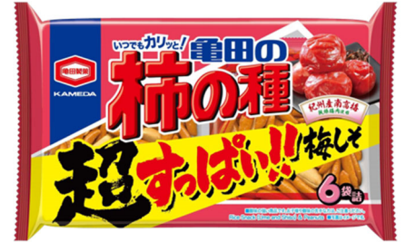
『161g 亀田の柿の種 超梅しそ 6袋詰』