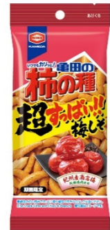
『47g 亀田の柿の種 超梅しそ』