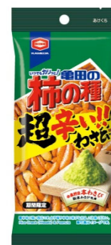
『47g 亀田の柿の種 超わさび』