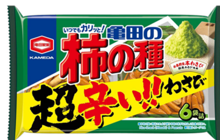
『161g 亀田の柿の種 超わさび 6袋詰』