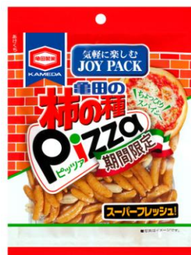
『220g亀田の柿の種ピッツァ』 『100g亀田の柿の種ピッツァ』