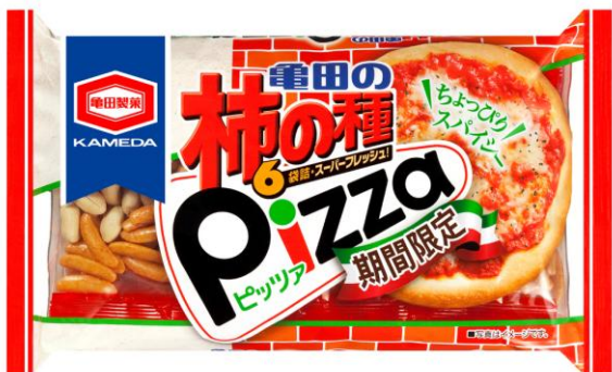
『240g亀田の柿の種ピッツァ』

亀田製菓株式会社(本社:新潟県新潟市、社長:田中 通泰)は『240g亀田の柿の種ピッツァ』、『100g亀田の柿の種ピッツァ』、『220g亀田の柿の種ピッツァ』(以下:『亀田の柿の種ピッツァ』)を2011年8月29日(月)から2012年2月末頃までの間、全国で期間限定発売いたします。