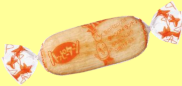
『120gハッピーターン』に入っているキャンディータイプの個包装