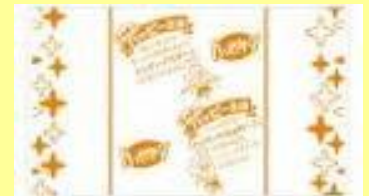
『120gハッピーターン』の包装紙

『ハッピーターン』の包装紙をよく読んだことはありますか？そこには「ハッピー王国」や「ターン王子」の秘密がいっぱい語られている「ちゃお★ハッピー王国」が記載されています。さらに、ラッキーアイテムとして「ラッキーな包み紙」が隠されています！見つけられる確率は内緒ですが、ぜひ探して下さい♪