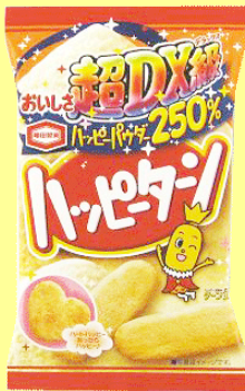
『50gパウダー250%ハッピーターン』 105円(税込)