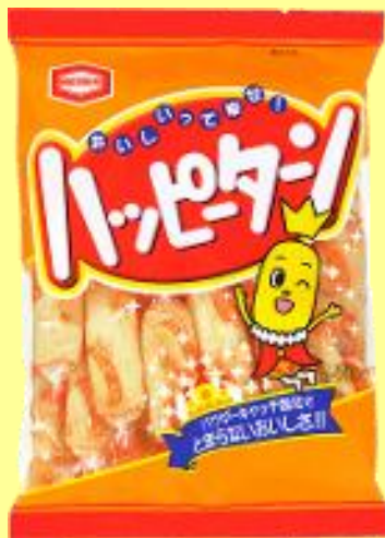
『120gハッピーターン』 参考価格 230円(税込)