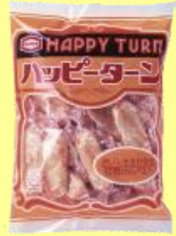
発売当時の『ハッピーターン』

『ハッピーターン』のおいしさの秘密は何と言っても味付けの粉「ハッピーパウダー」！1970年代、おせんべいと言えば醤油や塩味でしたが、粉で味付けし、全く新しい洋風せんべいに仕上げました。あまじょっぱい独特のおいしさで「ハッピーパウダー」を大好きなお客様が急増！とまらないおいさになりました！