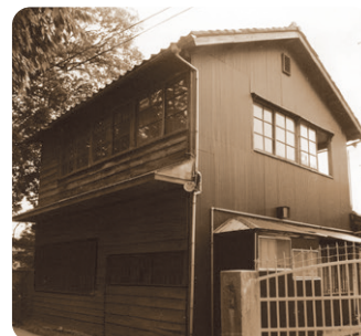
亀田町農産加工農業協同組合時代の事務所 亀田製菓はここから始まりました。