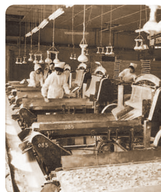
1965年頃の製造風景 1957年に株式会社として設立以来、他社に先駆けて米菓の量産体制を築き上げました。